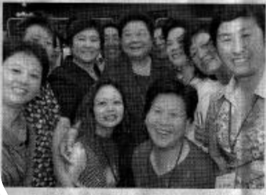
顾秀莲亲切会见女村官论坛与会代表。