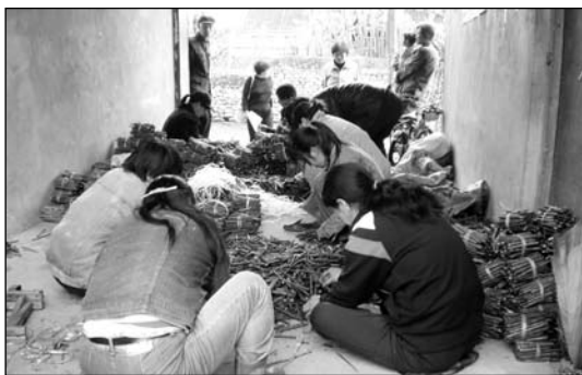
河北青龙妇女健康支持小组成员互助整理树苗