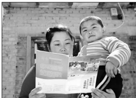
接受问卷调查的流动妇女