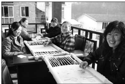
红火村的母亲们在新家园里开心地绣花

自2008年12月至2010年12月，北京农家女文化发展中心在香港社区伙伴项目资金支持下，联手都江堰妇联在向峨乡的莲月村、红火村、石花村、东林村开展了为期两年的《都江堰灾后母亲心理援助行动》项目。四个项目村共有130多位母亲失去孩子，有的失去的是独子，有的甚至两个孩子都失去了，这种伤痛是没经历过灾难的人无法想象的。该项目旨在补充建立持久妇女社会支持网络体系，以妇女健康支持小组为载体，通过开展一系列项目活动对母亲进行有效的心理辅导及有效扶持，互帮互助，开始新的生活，从而推动整个社区的灾后重建工作良性发展。