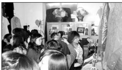
学员纷纷选购所需的衣服。