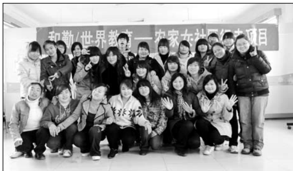
社区行走，给力的项目