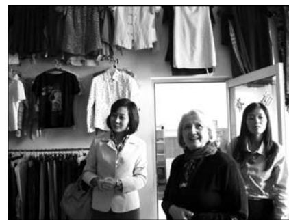
美国全球妇女问题无任所大使梅兰妮-弗维尔(中)女士参观爱心超市。