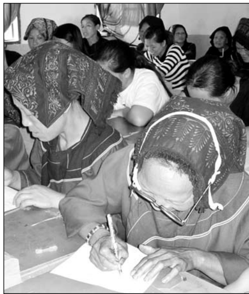
瑶族学员在认真学习

贵州丹寨县石桥村拥有全世界仅存的古法造纸工艺，属于首批国家非物质文化遗产名录，其工艺流程与明代宋应星著《天工开物》记载的图解基本一致，为了让这一传统手工艺流传下去，村民与政府不约而同想到了旅游、农家乐，苗族妇