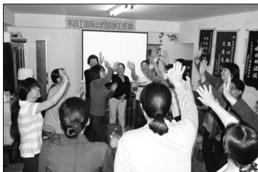
家政工国际公约工作坊

对于走出自己熟悉的村庄，离开家乡父老亲人、丈夫儿女的家政工姐妹，当她们面对着陌生的城市，遇到不被人理解和尊重的人和事，有的姐妹开始抱怨命运的不济，社会的不公，雇主的无情。