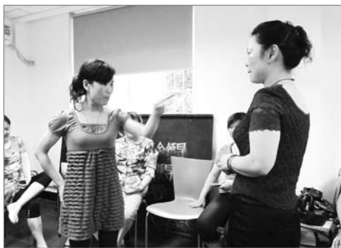
上海 小组活动，家政工现场表演与雇主之间的矛盾

“上海农家女家政工合作社”项目于2010年1月1日开始启动，2010年7月31日项目完成，北京农家女文化发展中心与上海好事服务技能培训中心合作，由上海民政局从福利彩票中拨出资金，NPI主办的公益创投大赛支持。