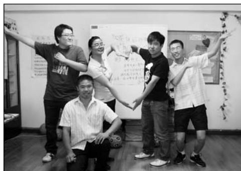
在健康快乐儿童教师培训中老师们正在进行建组活动