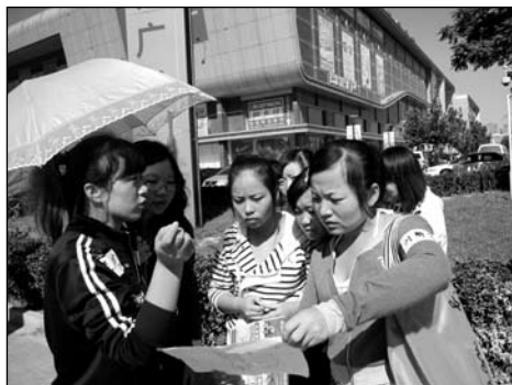
学员在天通苑社区进行社区行走实践