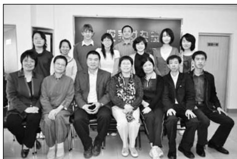
影子报告培训研讨会