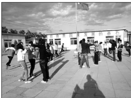
正在东方红学校开展的健康快乐儿童课中进行团体热身